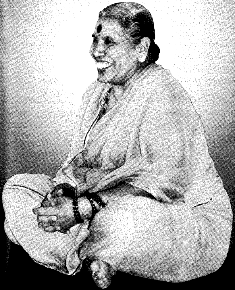
प.पू. ताईमहाराज चाटुफळे